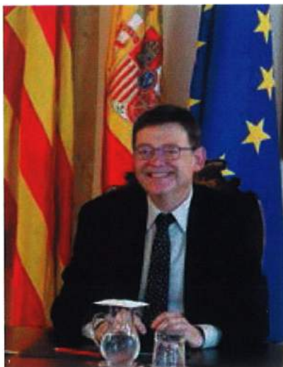
XIMO PUIG I FERRER